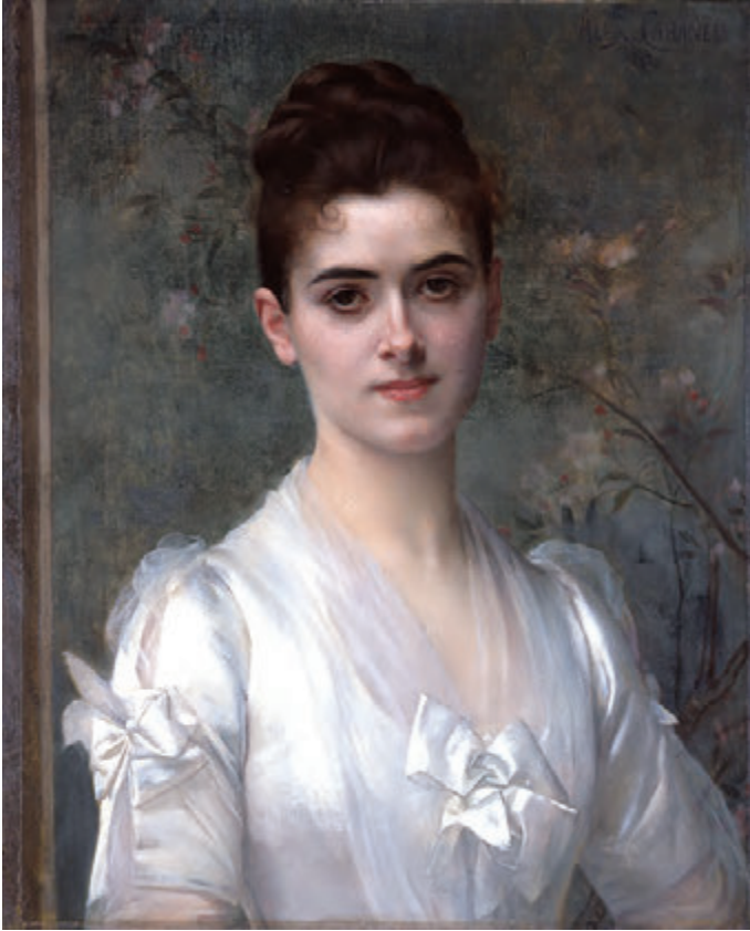
アレクサンドル・カバネル《若い女性の肖像》 1886年、油彩／カンヴァス、島根県立美術館

「白」は絵画制作において、なくてはならない色である。にもかかわらず、「何もない」と認識されがちであり、他の色より注目される機会が少ないように感じる。そこで、西洋絵画、日本洋画、日本画、版画を一堂に集め、縁の下の力持ちともいえる「白」のあり方を探ってみようと試みたのが、ひろしま美術館（広島市中区基町）で3月22日（日）まで開催している「白の魔法 ―モネ、大観も使った最強の色―」展である。