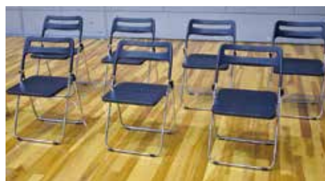
仮設座席の配置(イメージ)