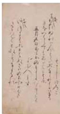
伝 後鳥羽天皇 拾遺和歌集切(前期展示)