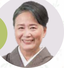
俳人 夏井いつきさん

1957年生まれ。松山市在住。8年間の中学校国語教諭経験を経て俳人に転身。俳句集団「いつき組」組長。「プレバト!!」(MBS/TBS系)、「NHK俳句」などテレビ、ラジオのほか、雑誌、新聞、webの各メディアで活躍中。「100年俳句計画」の志のもと、俳句の豊かさ、楽しさを伝えるべく、俳句の授業(句会ライブ)、全国高等学校俳句選手権大会「俳句甲子園」の創設に関わり、俳句の指導にも力を注ぐ。朝日新聞「愛媛俳壇」選者、愛媛新聞日曜版小中学生俳句欄選者。2015年より俳都松山大使。「夏井いつきの超カンタン! 俳句塾」(世界文化社刊)、句集「伊月集籠」(朝日出版社刊)、「子規365日」(朝日新聞出版刊)ほか著書多数。