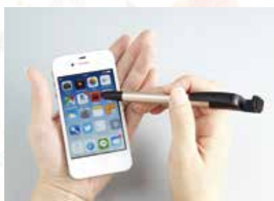
※タッチペン・スマートフォンスタンド機能付き

中国新聞レディースクラブSTORYをより良い内容にするため、同封のアンケートにご協力ください。必要事項を記入し、3月18日(木)のアンミカさん特別講演会会場にお持ちください。ご協力いただいた方全員にもれなくSTORYオリジナルボールペンをプレゼントします。