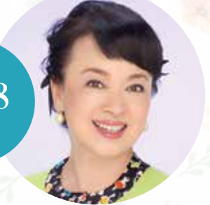
歌手・女優・木版画家 ジュデイ・オングさん

台湾生まれ、3歳で来日。9歳で劇団ひまわり入団。11歳の時、日米合作映画「大津波」でデビュー。その後テレビドラマ、映画、舞台に多数出演。歌手デビューは16歳。以来スマッシュヒットを飛ばし、1979年「魅せられて」の大ヒットにより日本レコード大賞他、数々の賞を受賞。木版画家としては、14回の日展入選を果たし、2005年には日展特選を受賞、国内外で個展を開催している。また数々のチャリティコンサートをプロデュース。ボランティア活動にも意欲的に取り組み、現在、ワールドビジョンジャパン親善大使、日本介助犬協会介助犬サポート大使、ポリオ根絶大使を務めている。18年3月、6年振りのニューシングル「ほほえみをありがとう」、12月には初のジャズアルバム「ALWAYS」(日本コロムビア)がリリースされた。