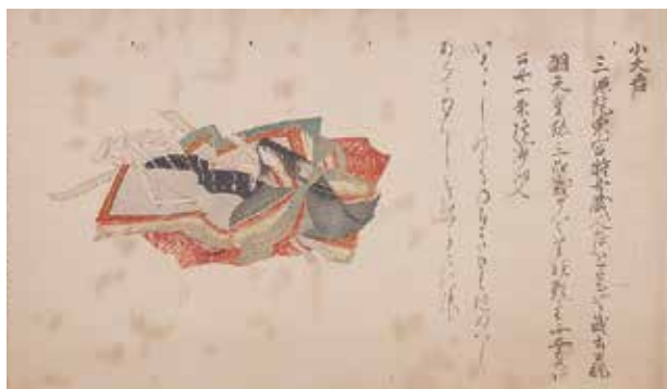
佐竹本三十六歌仙絵巻(模本、部分) 田中親美監修(前期展示)