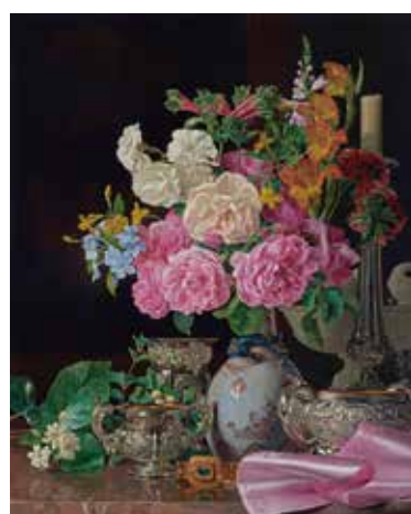
フェルディナント・ゲオルク・ヴァルトミューラー「磁器の花瓶の花、燭台、銀器」1839年

オーストリアとスイスに挟まれた小国、リヒテンシュタイン。同国の君主であるリヒテンシュタイン侯爵家は、優れた美術品収集を一族の榮譽とする家訓を掲げ、名品の収集に力を注いできました。そのコレクションのきらめくような華麗さは、宝石箱にもたとえられます。本展では、ルーベンスやクラーナハ(父)、ヤン・ブリューゲル(父)を含む侯爵家秘蔵の油彩画と、東洋と西洋の交流の歴史を示す陶磁器など、合わせて126点を展示します。宮廷空間を優美に飾った、絵画と陶磁器の共演をお楽しみください。